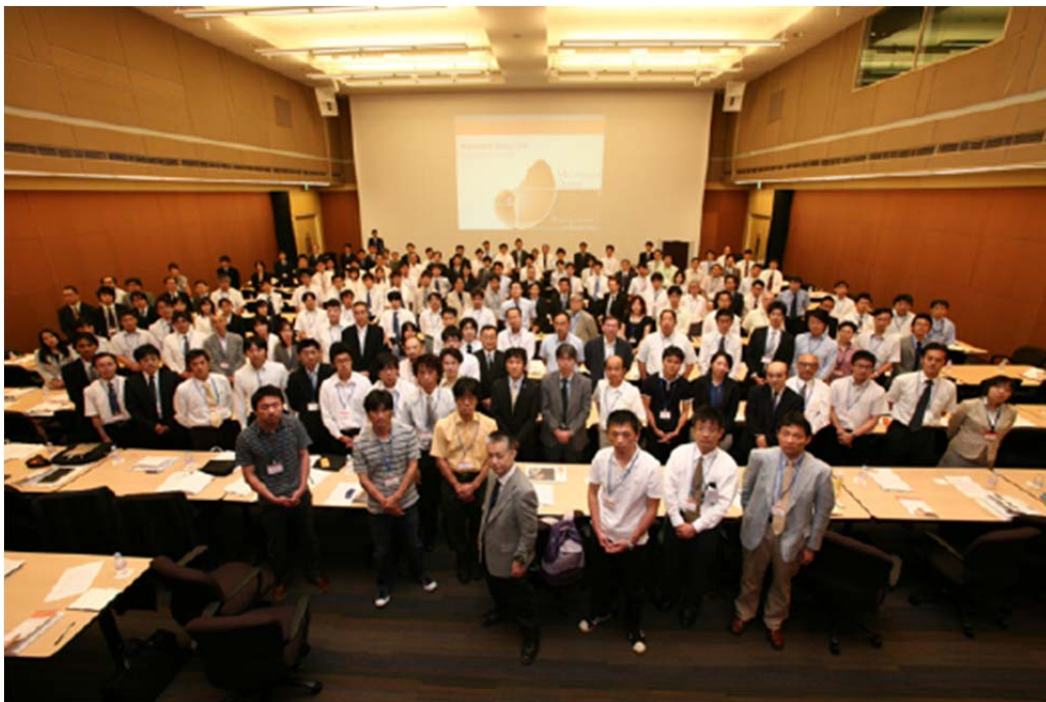
Mechanical Design 2008, 東京コンファレンスセンター, 2008 年 7 月 10 日

先に述べた User Subroutine の旧来の使用法は、主に後半の c~e の部分に相当している。これに加えて、前段の a および b のステップに User Subroutine を適用することができれば、汎用プログラムのカスタマイズの可能性は大きく広が